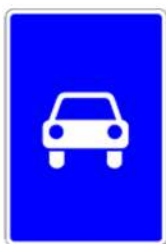
5.3 «Дорога для автомобилей»